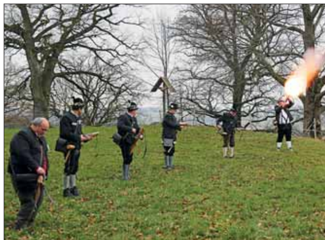
Auch heuer begrüßte der Böllerschützenzug Grafrath das neue Jahr wieder mit sieben Salven auf der Mesmeralm.