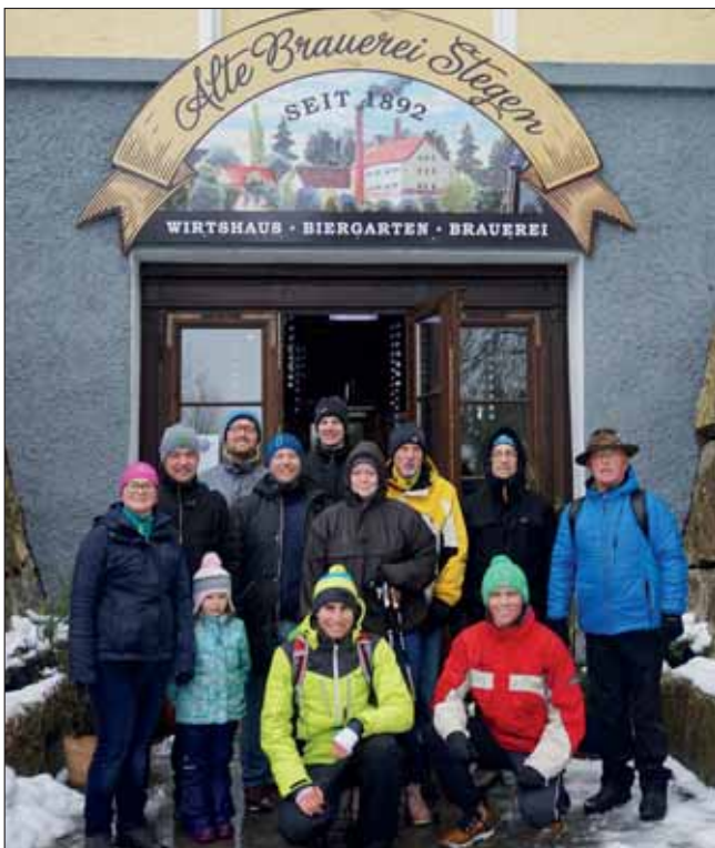
Am Ziel angekommen: Die Alte Brauerei in Stegen am Ammersee.

Obwohl die Tennisplätze unter einer tiefen Schneedecke begraben sind, startete die Tennisabteilung des SV Kottgeisering sportlich ins neue Jahr. Bei der traditionellen Winterwanderung trotzten 15 junge und junggebliebene Teilnehmer dem stürmischen Winterwetter und wanderten an Dreikönig entlang des Ampermooses von Kottgeisering über Eching nach Stegen. Dort erwarteten sie pünktlich zum Mittagessen schon weitere Tennisfreunde. Zusammen genossen alle die wohlverdiente Stärkung in der Alten Brauerei, ehe man sich am Nachmittag auf den Rückweg machte.